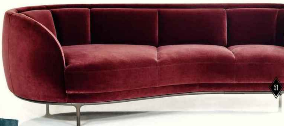
Vuelta 197 - Sofa lounge cadre bois et étagère bois moulé, piétement bronze et tissu. L. 241 x P. 114 x H. 77 cm. Design Jaime Hayón.

Les scénographies sont la marque de fabrique de la Milan Design Week, en résonance avec le salon du meuble. De véritables variations autour de la couleur, des matières, et des formes... Effet waouh garanti !