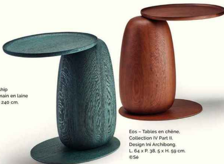
Eos - Tables en chêne. Collection IV Part II. Design Ini Archibong. L. 64 x P. 38. 5 x H. 59 cm.