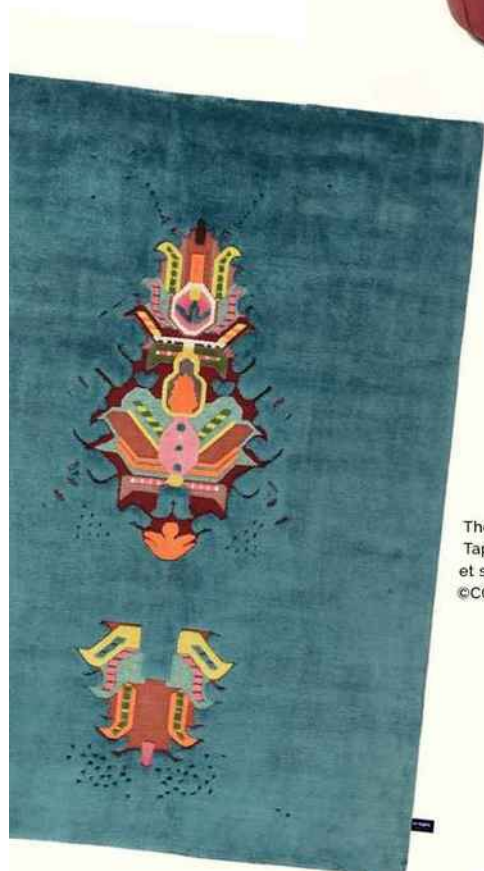
The Mothership Tapis noué main en laine et soie. 170 x 240 cm.