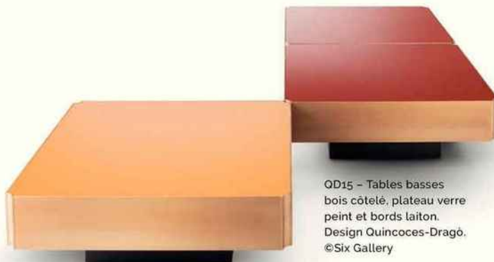
OD15 - Tables basses bois côtelé, plateau verre peint et bords laiton. Design Quincoces-Dragò.

PalermoUno - Appartement/galerie au cœur du quartier Brera, dédié à l'art et au design mettant en scène des expositions éphémères et créé par Sophie Wannenes. En partenariat avec les tissus Créations Métaphores. Suspensions Pop-Up, Magic Circus.